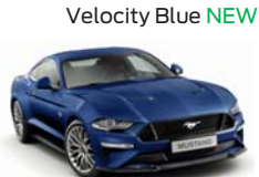
Velocity Blue NEW